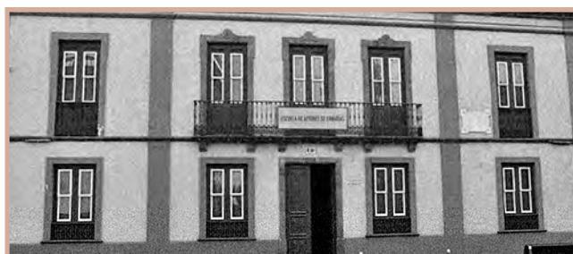
Casa de Anchieta - Antigua sede de la EAC

En este último curso 2020/2021 se han conmemorado dos hechos: el 45 aniversario del inicio del proyecto educativo de la EAC en el año 1975 y el 25 aniversario de su autorización como centro reglado para impartir las enseñanzas superiores de Arte Dramático en 1996.