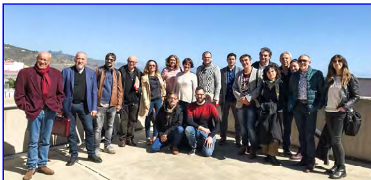
III Encuentro Estatal de Escuelas Superiores de Arte Dramático

Superado este grave contratiempo la actividad del Centro vuelve a la normalidad. No obstante, el proceso de adaptación al espacio Europeo de Educación Superior debe continuarse en unas condiciones económicas limitadas. Las relaciones con las otras ESAD se intensifican, lo que supone un apoyo estratégico importante al propiciar la realización de encuentros y proyectos de colaboración pedagógica. En febrero de 2019 se celebra en Canarias el III Encuentro Estatal de Escuelas Superiores de Arte Dramático, entre otros temas se estudian propuestas para favorecer la colaboración entre las ESAD e implementar acciones que fortalezcan y dinamicen un espacio común, así como estudiar el desarrollo normativo de la Ley de Enseñanzas Artísticas Superiores.