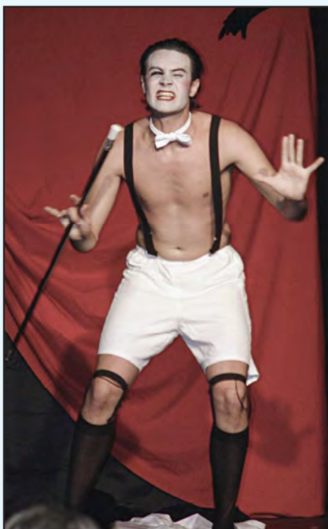
Alumno de EAC